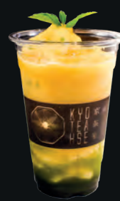
23. Matcha Peach Nector (Ice Blended Drink) 抹茶ピーチネクター