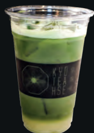
24. Yuzu Matcha ゆず抹茶