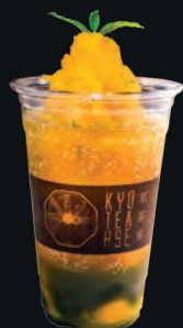
22. Ume Matcha Mojito (Non Alcoholic) 梅抹茶モヒート