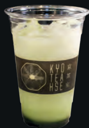
25. Matcha Calpico 抹茶カルピコ