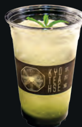
26. Yuzu Matcha Fiz ゆず抹茶フィズ