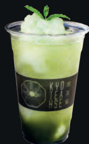
21. Yuzu Matcha Mojito (Non Alcoholic) ゆず抹茶モヒート